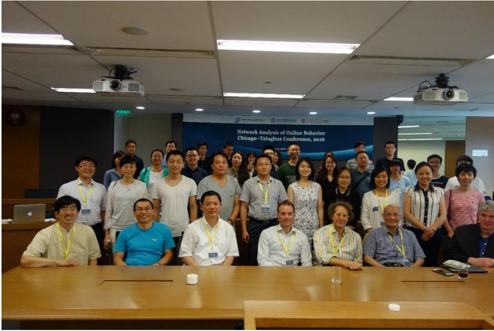
(部分) 主要嘉宾合影